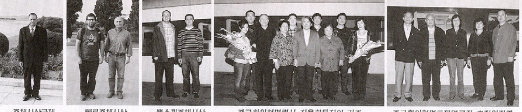
주체사상국제연구소 리사장, 만경대 학생소년궁전 예술소조원들, 중국항일혁명렬사 장우동지의 가족, 중국항일혁명투쟁연고자 호진일가족

주체사상국제연구소 리사장 도착 【평양 10월 8일발 조선중앙통신】 조선로동당 창건 65돐을 경축하는 주체사상국제연구소 리사장이 8일 평양에 도착하였다. 가 지 에 서 진 행 선물에 맞추어 추가락을 이어 나가는 그들의 얼굴마다에는 조선로동당을 혁명하게 이끄는 혁명의 수뇌부를 높이 모시고 장강생소년궁전상공으로 축포가 연이어 터져서 수도의 밤하늘을 황홀하게 수놓았다. 관람자들은 로속하고 세련된 명도로 조선로동당의 존엄과 권위를 온 세상에 떨치시어 선군조선의 기치가 높이 강성번영